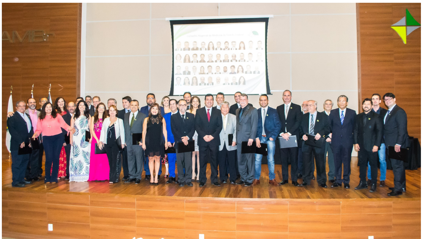
Posse dos conselheiros do CRM-DF