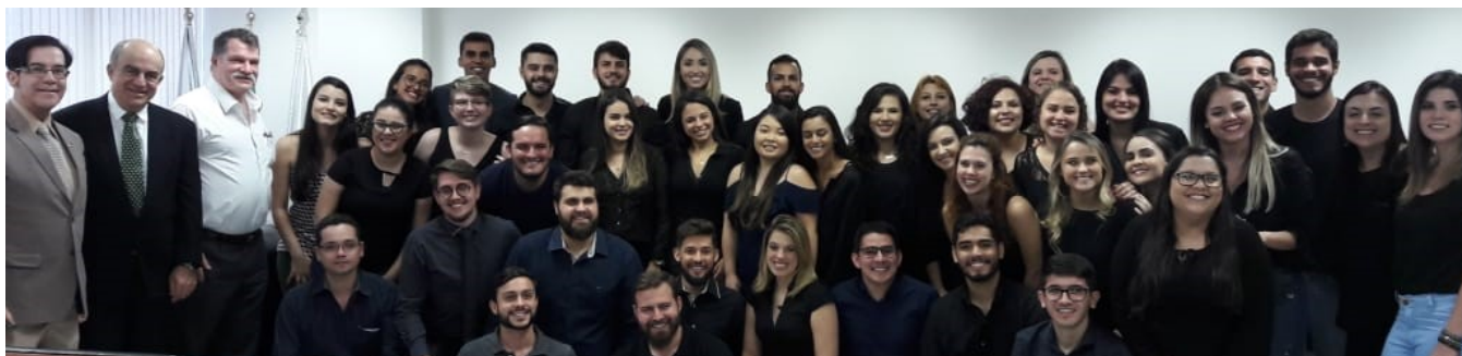
Jovens Médicos dão entrada na documentação necessária para tirar o registro profissional

As 21 vagas do Programa Mais Médicos foram preenchidas no DF. Os servidores do Departamento de Registros da autarquia se mobilizaram durante os dias 22, 23 e 24 de novembro para cadastrar os novos profissionais que pretendem se inscrever no programa. Foram efetivados 160 registros nos três dias de mutirão.