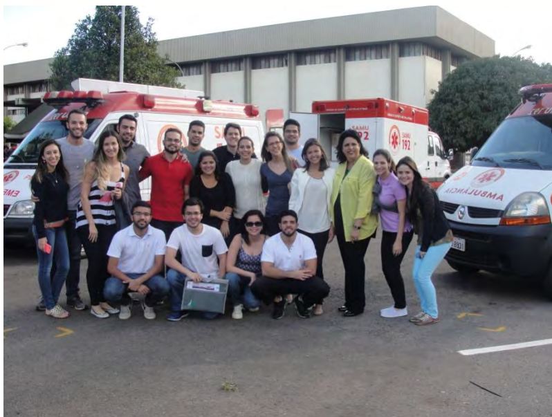
Curso do SAMU