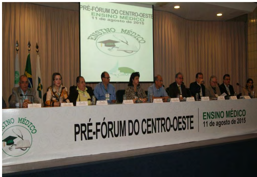
Pré-Fórum de Ensino Médico do Centro-Oeste