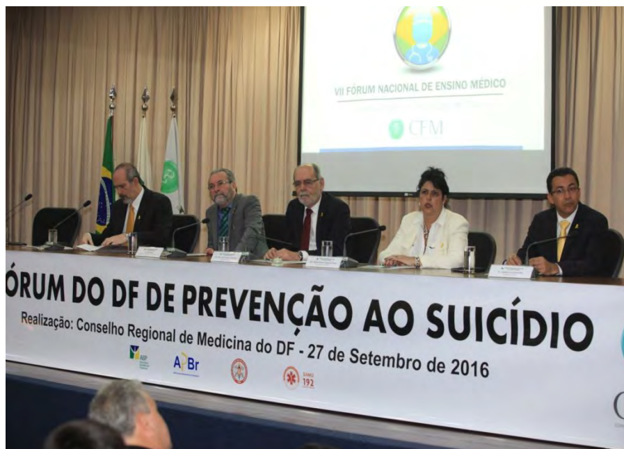
Fórum de Prevenção ao Suicídio